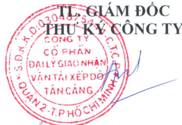
Đào Tuấn Anh

Tôi cam kết các thông tin công bố trên đây là đúng sự thật và hoàn toàn chịu trách nhiệm trước pháp luật về nội dung các thông tin đã công bố./