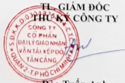
Đào Tuấn Anh

Tôi cam kết các thông tin công bố trên đây là đúng sự thật và hoàn toàn chịu trách nhiệm trước pháp luật về nội dung các thông tin đã công bố./.